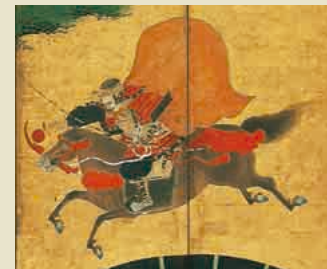
熊谷次郎直実 (埼玉県立博物館蔵)