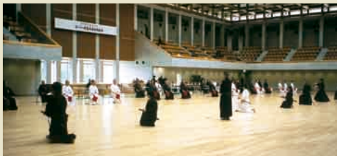
▲埼玉県居合道大会